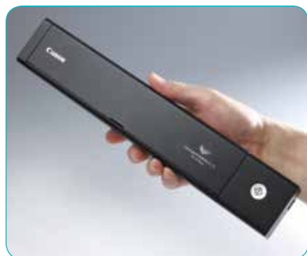
Ултра тънък и лек