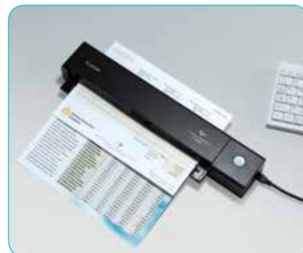
Подаващо устройство за документи за 10 листа с двустранно сканиране

Домашните потребители също ще се насладят на работата с P-208II, защото той е идеален за сканиране на сметки. Режимът за сканиране на изображения е идеален за прецизно сканиране на стари снимки.